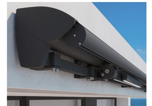
Bergen, Semi öppen