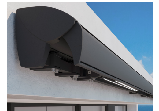
Bergen, Semi kasset